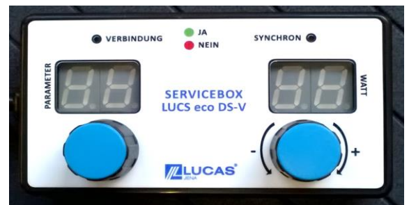
Zubehör für DS-V LUCS® eco-Servicebox